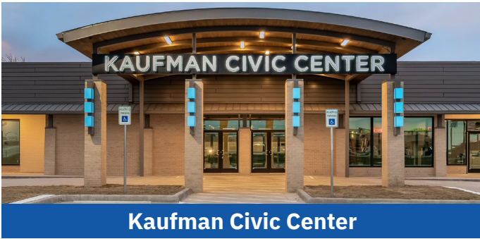
Kaufman Civic Center